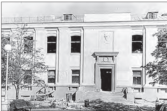
Илл. 1. Литературный музей им. Янки Купалы в Минске

Еще одним значимым проектом является строительство здания Музея Янки Купалы в парке 30-летия БССР в городе Минске (авторы проекта—В. Волчек и И. Володько; сейчас—Государственный литературный музей Янки Купалы). В состав проекта входит 6 единиц хранения 3 . В проектном задании отмечалось, что «здание музея... построено в парке 30-летия БССР в угловой его части... на месте, где был дом, в котором жил и работал поэт... Здание музея должно быть запроектировано в простых архитектурных формах, в деталях отображать искусство белорусского народа и соответствовать своему назначению. Так как сооружение размещается в парке и открыто со всех сторон, то кроме главного фасада должно быть уделено соответствующее внимание и остальным фасадам». На втором этаже здания для экспозиций предполагалось выделить 10 помещений, которые отражали основной творческий путь поэта в хронологической последовательности 4 .