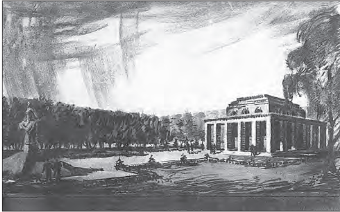
Илл. 3. Проект здания филиала Музея Великой Отечественной войны в д. Тростенец (нереализованный)